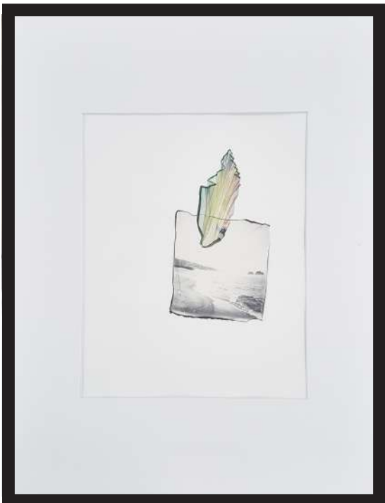
Anouck Oliviero Titre: Untitled - Série plastique 03 Technique: transfert d'émulsion polaroid sur papier acrylique Dimensions: A3