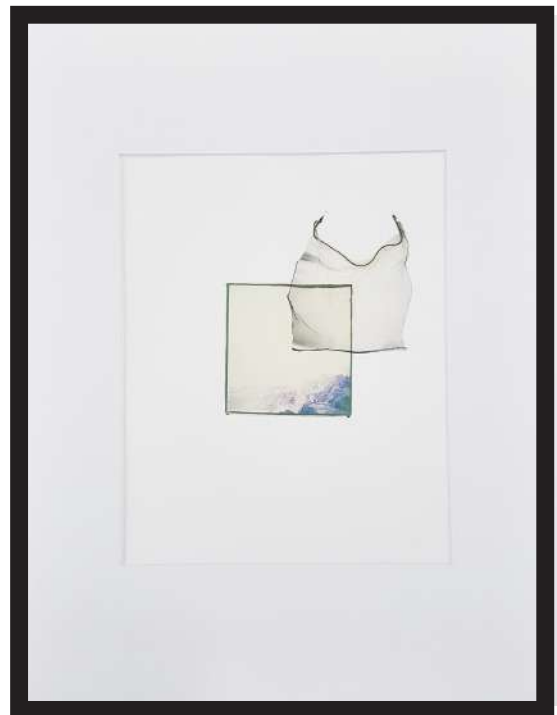
Anouck Oliviero Titre: Untitled - Série plastique 02 Technique: transfert d'émulsion polaroid sur papier acrylique Dimensions: A3