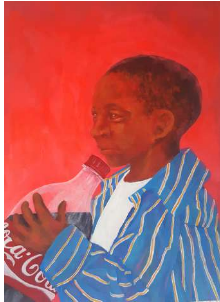
AhnJi Titre: I LOVE PLASTIC (Plastic Lover) Technique: Acrylique sur papier Dimensions: 29x41 cm